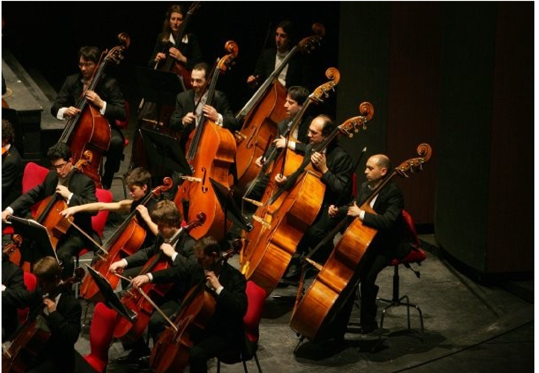
La Filarmonica '900 del Teatro regio di Torino