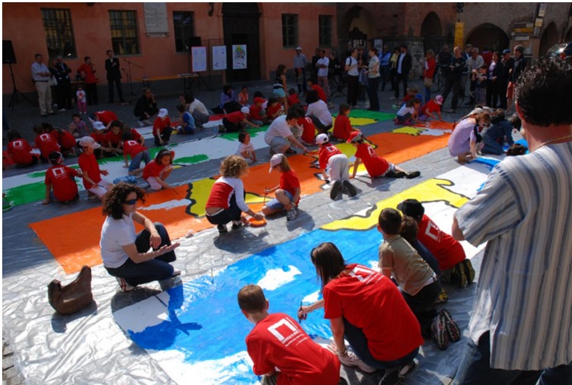
Il Dipartimento Educazione del Castello di Rivoli - Museo d'Arte Contemporanea