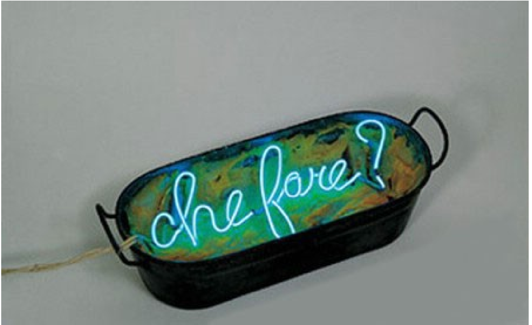
Mario Merz, Che fare? - 1968